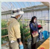
バラ農家体験の様子